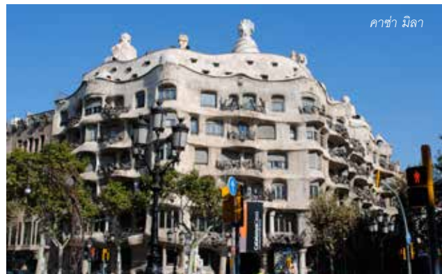
คาซ่า มิลา