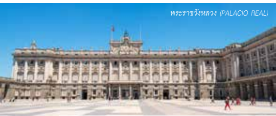
พระราชวังหลวง (PALACIO REAL)

19.30 น. รับประทานอาหารค่ำ ณ ภัตตาคาร จากนั้นนำท่านเดินทางสู่ที่พัก โรงแรม Confortel Pio XII หรือเทียบเท่า