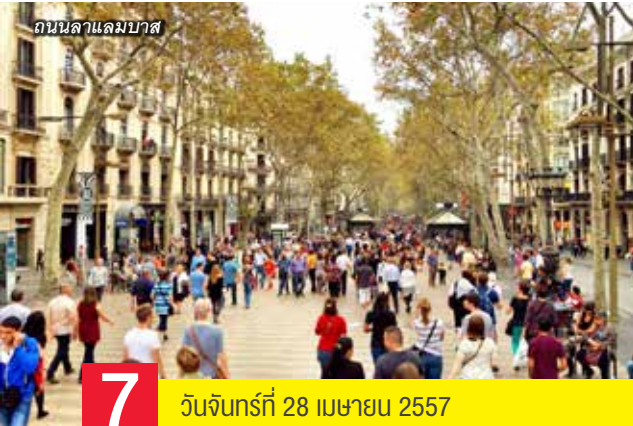
ถนนลาแลมบาส

19.30 น. รับประทานอาหารค่ำ ณ ภัตตาคารจีน Private Room + Karaoke จากนั้นนำท่านเข้าสู่ที่พัก โรงแรม Frontair Congress หรือเทียบเท่า