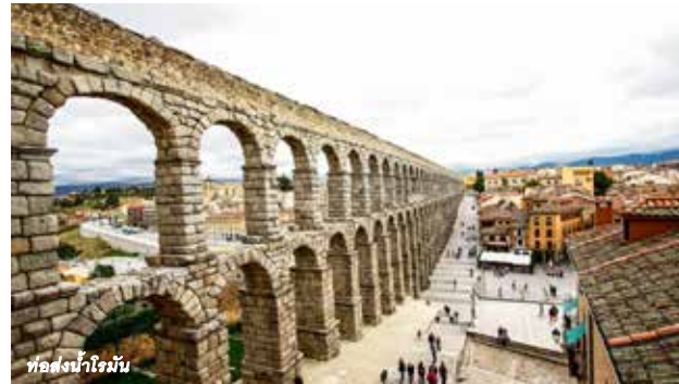
ทอส่งน้ำโรมัน

10.15 น. ออกเดินทางสู่กรุงมาดริด ประเทศสเปน โดยเที่ยวบินที่ TK 1857 (ระยะเวลาในการบิน 4 ชั่วโมง 10 นาที)