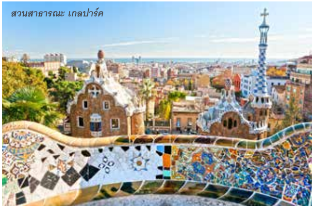
สวนสาธารณะ เกลปาร์ค