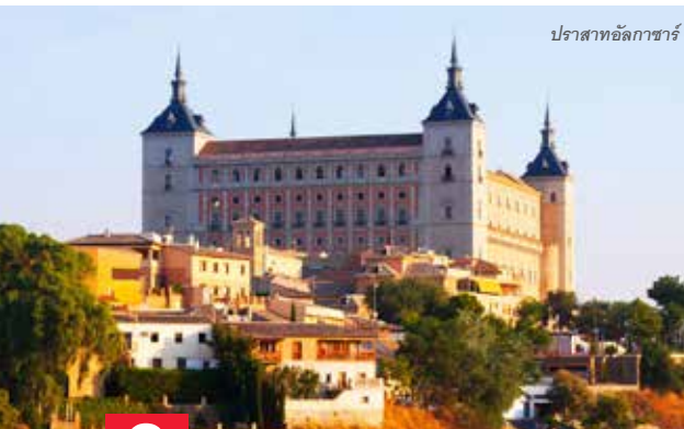
ปราสาทอัลกาซาร์

23.35 น. ออกเดินทางสู่กรุงอิสตันบูล ประเทศตุรกี โดยเที่ยวบินที่ TK 061 (ระยะเวลาในการบิน 10 ชั่วโมง 25 นาที)