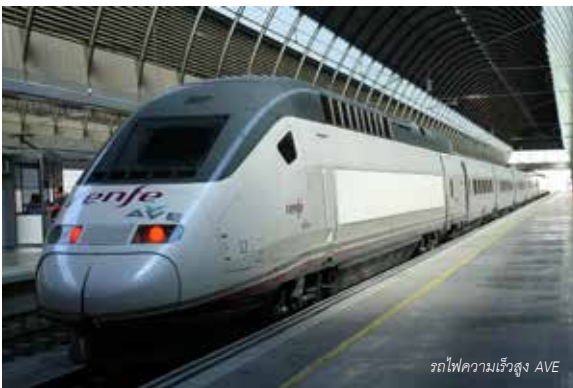
รถไฟความเร็วสูง AVE

เช้า รับประทานอาหารเช้า ณ ห้องอาหารของโรงแรม จากนั้นนำท่านผ่านชม น้ำพุที่จัตุรัสซีเบเลส ชมรูปแกะสลักหินอ่อนเทพธิดาซีเบเลส นั่งรถเทียมด้วยสิงโต 2 ตัว พาไปชมสัญลักษณ์ที่สำคัญ รูปปั้นดอน กิโมเต วีรบุรุษนักฝันผู้ยิ่งใหญ่ จากวรรณกรรมสเปนชื่อดัง 'Don Quixote de la Mancha' จากนั้น นำท่านชมความสวยงามของ พระราชวังหลวง (Palacio Real) สร้างด้วยหินทั้งหลัง ในสไตล์บารอก ผสมผสานระหว่างศิลปะแบบฝรั่งเศสและอิตาลี ตั้งอยู่บนเนินเขาบริเวณริมฝั่งแม่น้ำแมนซานาเรส