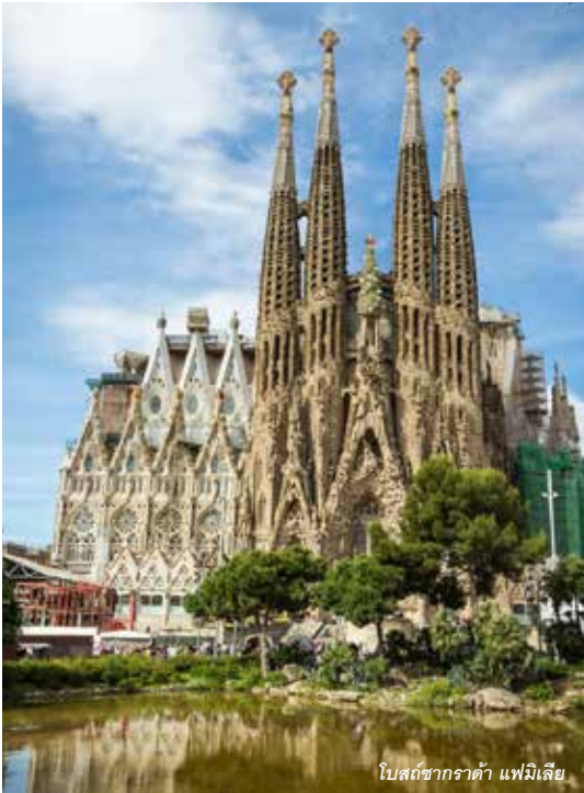
โบสถ์ซากราต้า แฟมิลีเย